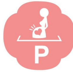
孕婦優先停車位 Reserved Parking for Pregnant Women