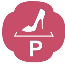
女士優先停車區 Reserved Parking for Women