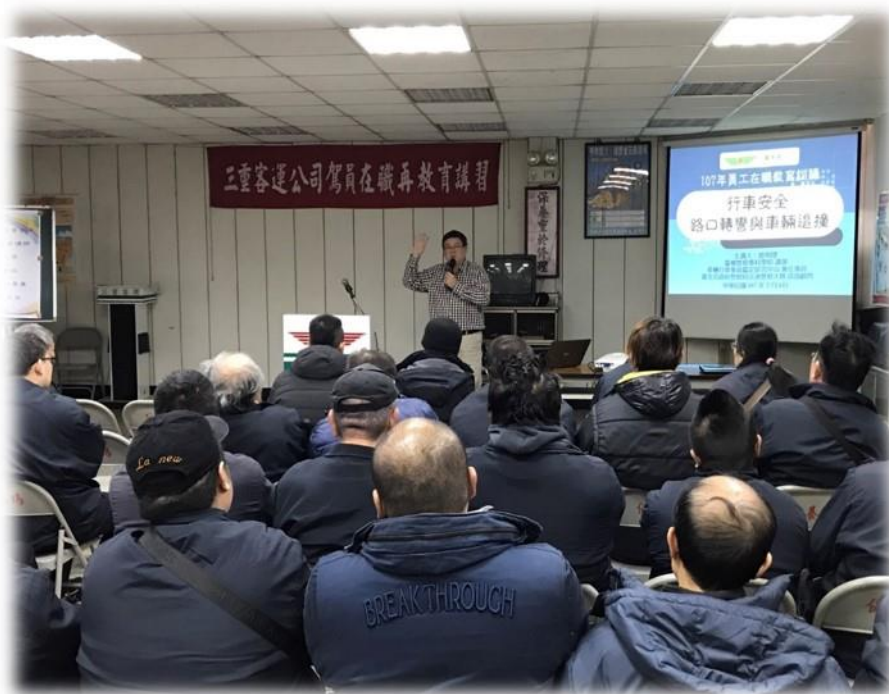
圖三 公車駕駛員教育訓練（一）