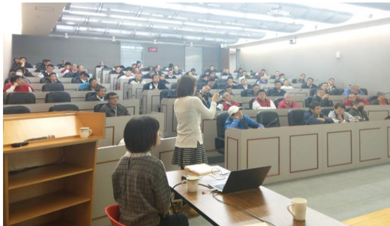
圖六 公車行安講習（二）