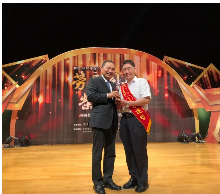
圖七 公車優良駕駛頒獎典禮