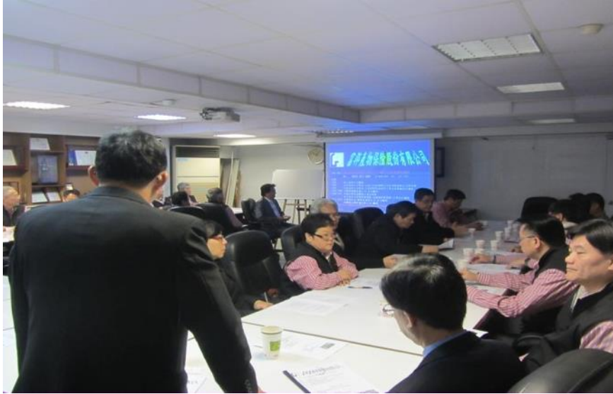
圖四 公車駕駛員教育訓練 (二)