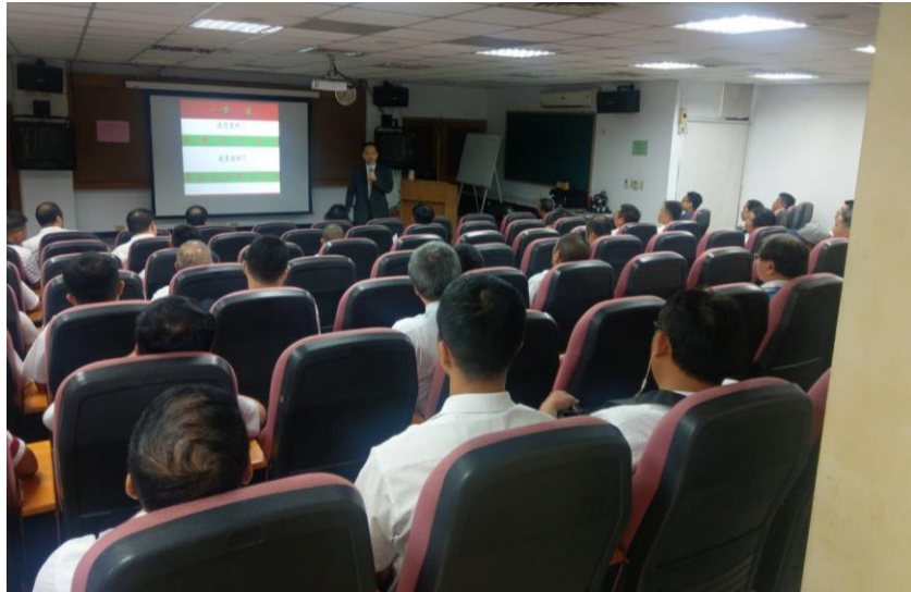
圖五 公車行安講習（一）