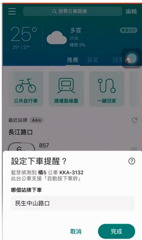
↑ 手機 App(Bus+)預約下車畫面